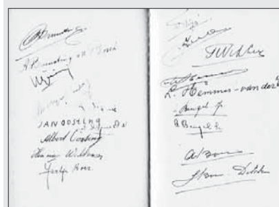
Handtekeningen in het receptieboek