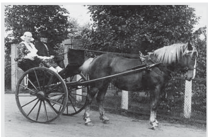
Willem en Gees Kuik in een sjees tijdens een dorpsfeest in de 20-er jaren van de vorige eeuw.