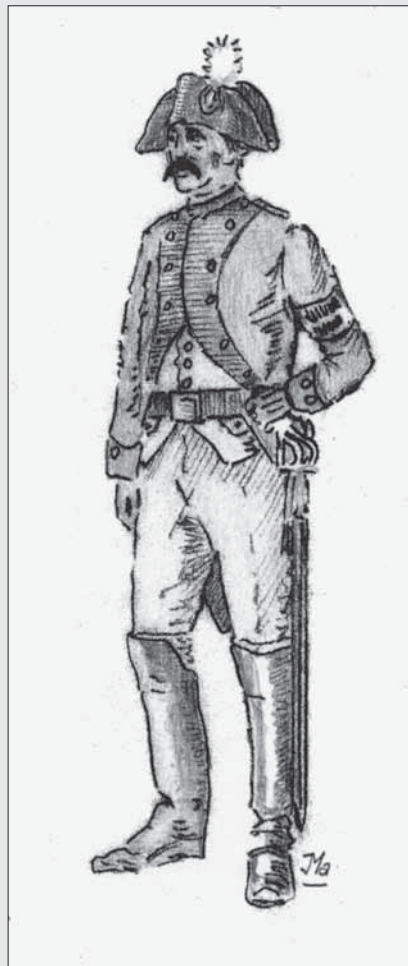
Veldwachter van 1812 tot 1830 in soldatenuniform met Franse hoed, metalen schild op de arm en infanteriesabel